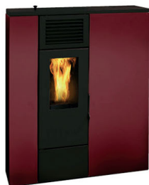
SERIE NERO BORDEAUX

La stufa ad aria modello "Lampedusa" è caratterizzata dalle dimensioni estremamente compatte che la rendono facilmente inseribile in ambienti con problemi di spazio.